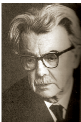
Г. Г. Нейгауз

Лит.: Школа Нейгаузов в Челябинске / Н. Рубинская // Автограф. Челябинск-Арт. 2002. № 3.