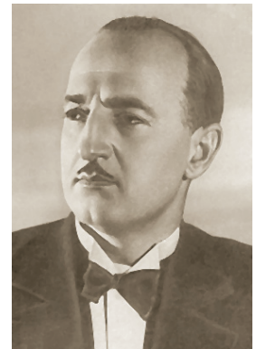
Д. Г. Бадридзе

БАДРИДЗЕ Давид (Датико) Георгиевич (23.03(04.04).1899, Кутаиси — 26.01.1987, Москва), оперный певец (лирический тенор), народный артист Грузинской ССР (1943), лауреат Сталинской премии I степени (1950). Получил высшее образование на медицинском факультете Тифлисского университета, затем учился в Тифлисской консерватории по классу Е. А. Вронского. С 1926 по 1934 и с 1941 по 1944 солист Тбилисского театра оперы и балета, с 1934 по 1936 солист Свердловского театра оперы и балета. В марте 1936 выступал в Челябинске. В 1936—1941 и 1944—1948 солист ГАБТ. В 1948 оставил сцену.