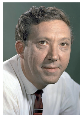
Ю. В. Никулин

НИКУЛИН Юрий Владимирович (18.12.1921, г. Демидов Смоленской губ. — 21.08.1997, Москва), советский российский артист цирка (клоун), цирковой режиссер, киноактер, телеведущий, народный артист РСФСР (1969), СССР (1973), Герой Социалистического Труда (1990), лауреат Государственной премии РСФСР имени братьев Васильевых (1970). В 1939 был призван в Красную армию, служил в 115-м зенитно-артиллерийском полку. В Великую Отечественную войну воевал под Ленинградом. Демобилизован в мае 1946. Учился в студии разговорных жанров при Московском цирке на Цветном бульваре. Выступал на манеже с 1948. Работал ассистентом у клоуна Карандаша. С 1950 работал в дуэте с М. Шуйдиным. Неоднократно бывал в Челябинске. Снимался в кино: «Девушка с гитарой» (1958), «Пес Барбос и необычный кросс» (1961), «Бриллиантовая рука» (1968), «Старик»