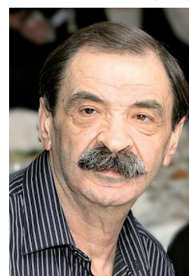
И. Л. Олейников