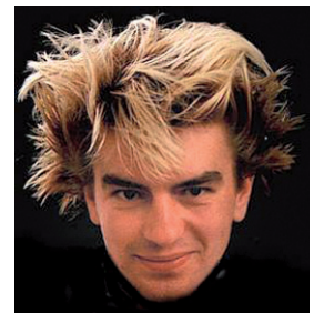
А. В. Балунов

БАЛЬМОНТ Константин Дмитриевич (03(15).06.1867, дер. Гумнищи Шуйского уезда Владимирской губ. — 23.12.1942, Нуази-ле-Гран, близ Парижа, Франция), поэт, критик, переводчик. псевдонимы: Гридинский («Ежемесячные сочинения»), Лионель («Северные цветы»). Автор 35 книг стихов и 20 — прозы, многочисленных переводов из западно-европейской поэзии, статей об английской, испанской поэзии. Получил известность