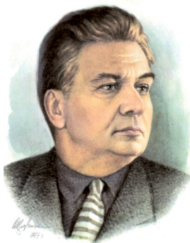
Н. Ф. Погодин

ПОГОДИН Николай Федорович (псевдоним; настоящая фамилия Стукало; 03(15).11.1900, ст. Гундоровская Донецкого округа Области войска Донского — 19.09.1962, Москва), журналист, драматург, заслуженный деятель искусств РСФСР (1949), лауреат Сталинской (1941; за пьесу «Человек с ружьем»), Ленинской премии (1959; за драматическую трилогию «Человек с ружьем», «Кремлевские куранты», «Третья патетическая»). В юности работал посыльным в магазине, экспедитором в газете. Публиковал материалы в газетах «Дон-