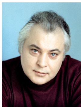
Н. Г. Путилин