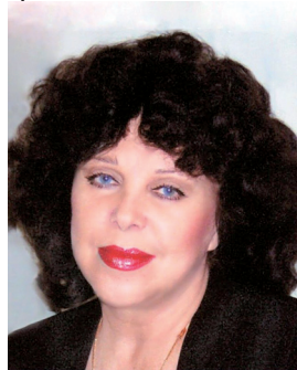
С. И. Резанова

РЕЗАНОВА Светлана Ивановна (09.06.1942), советская и российская эстрадная певица, актриса, заслуженная артистка РСФСР (1981). С детства участвовала в художественной самодеятельности. Окончила театральную студию при Волгоградском драматическом театре. Играла в Днепрпетровском русском драматическом театре, затем окончила ГИТИС (факультет «Режиссура эстрады и массовых представлений»). Переехала в Казань, стала выступать в эстрадном ансамбле «Ветерок», затем в джаз-оркестре под управлением А. Кролла. Около года проработала в Ленинградском мюзик-холле, затем переехала в Москву и стала солисткой ансамбля «Веселые ребята». В 1972 получила 1-ю премию на музыкальном конкурсе «Золотой Орфей» в Болгарии. Вернувшись домой, начала сольную карьеру. Работала в Московском театре, была ведущей в ресторанах «Интурист», «Арбат», «Лабиринт». 26.07.1975 приняла участие в концерте «Добрый вечер, Челябинск!»