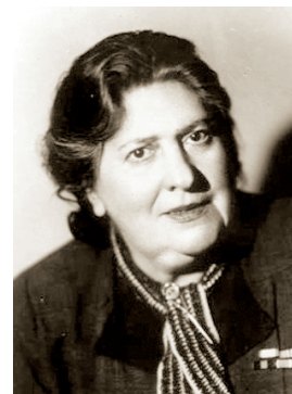
Р. Р. Рейзен

русская актриса ранней эпохи отечественного немого кино, жена М. М. Климова. Актриса Малого театра (с 1913). В июле 1935 выступала в Челябинске. Снималась в кино: «Мазепа» (1909), «Кумиры» (1915), «Тени ушедшего, листья опавшие» (1916) и другие фильмы. Лит.: Малый театр — всегда наш желанный гость // ЧР. 1935. 23 июля.