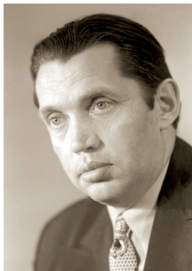
Р. И. Рождественский