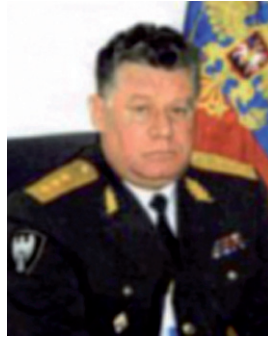
Е. В. Баряев

Лит.: Челябинскую дивизию внутренних войск посетил генерал Баряев / А. Чуносков // ВЧ. 1998. 13 апр.