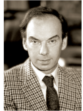
А. В. Баталов