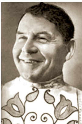
И. Ф. Рубан

ным конструкциям сначала наверх, затем спускаясь на арену, выполняли на ходу различные трюки. С 1954 в Москве. Медведи Рубана неоднократно снимались в кинофильмах: «Садко», 1953; «Полесская легенда», 1955; «Новый аттракцион», 1957; «Операция «Кобра»», 1959; «Рой», 1989; «Живодер», 1991). В декабре 1980 — январе 1981 выступал в Челябинске. В 1988 оставил цирковой манеж. До смерти был прикован к кровати.