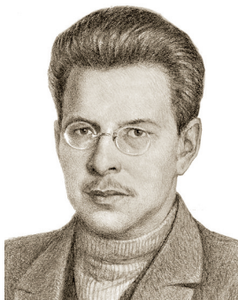
Я. Э. Рудзутак

РУДЗУТАК Ян Эрнестович (03(15).08.1887, хут. Цауни Курситенской волости Гольдингенского уезда Курляндской губ.— 29.07.1938, Москва), советский, профсоюзный, партийный и государственный деятель, участник революционного движения. Член РСДРП с 1905. С 1903 работал на заводе в Риге, вел партийную агитацию. В 1907 арестован, приговорен к 10 годам каторги. Освобожден после Февральской революции 1917. С конца