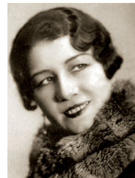
Л. А. Русланова