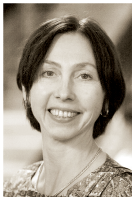
Н. Л. Семизорова