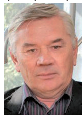
В. Н. Сергияков

СЕРГИЯКОВ Владимир Николаевич (08.04.1950, пос. Горошиха Красноярского края), артист театра, народный артист РФ (2011). В 1977 окончил театральный факультет Дальневосточного педагогического института искусств (мастерская С. З. Гришко). В 1977—1979 и с 1991 артист Приморского краевого драматического театра. В июле 1978 находился на гастролях в Челябинске (спектакли «Шрамы», «Танкер «Дербент»»). В 1979—1984 артист драматического театра Комсомольска-на-Амуре. В 1985—1986 артист Государственного русского драматического театра Улан-Удэ.