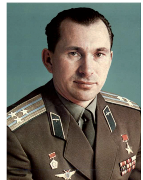
П. И. Беляев

БЕЛЯЕВ Павел Иванович (26.06.1925, с. Челищево Рослятинского района Вологодской обл. — 10.01.1970, Москва), летчик-космонавт СССР (1965), полковник, Герой Советского Союза (1965), участник советско-японской войны (1945), почетный гражданин г. Снежинска (1966). В 1943 добровольно вступил в ряды Красной Армии и, окончив Ейское авиационное училище морских летчиков-истребителей, участвовал в войне с Японией.