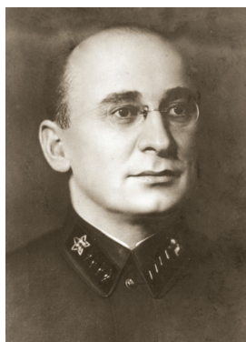
Л. П. Берия

Лит.: Создание атомной промышленности на Урале / В. Новоселов. Ч., 1999.