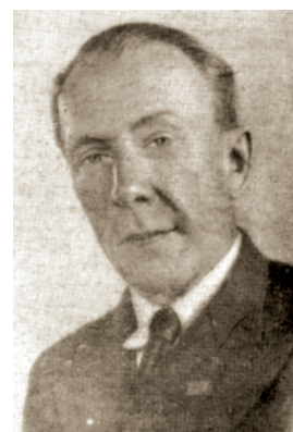
В. В. Хватов

ХЕНКИН Владимир Яковлевич (08(20).12.1883, Харьков — 17.04.1953, Москва), российский и советский актер, заслуженный артист РСФСР (1933), народный артист РСФСР (1946). Актер московского театра «Буфф» (с 1908). Артист эстрады (с 1911). Руководитель театра политотдела Кавказского фронта (1919—1921), театра «Палас» и «Вольный театр» (Москва). Актер Мюзик-холла, Театра оперетты (1928—1934) и Театра сатиры в Москве (1934). Исполнял куплеты, читал рассказы, имитировал известных артистов. 16.11.1942 участник концерта в Драматическом