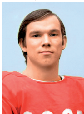
В. И. Шалимов

ШАЛИМОВ Виктор Иванович (20.04.1951, г. Солнечногорск Московской обл.), советский хоккеист, заслуженный мастер спорта СССР (1974). Игрок «Спартака» (Москва; 1969—1985), а также австрийских клубов («Инсбрук» и «Зальцбург»). В чемпионатах СССР провел 572 матча и забросил 293 шайбы. В чемпионатах мира и Европы и зимних Олимпийских играх — 51 матч, 36 голов. Участник суперсерий СССР — Канада 1974 и 1976/1977. В турнирах Кубка Канады — 8 матчей, 2 гола. В 1994—1995 тренер ХК «Спартак» (Москва). В 1995—1996 главный тренер ХК «Спартак» (Москва). С 2005 советник главы Мытищинского района по физической культуре и спорту. Заведующий кафедрой физкультуры Московского государственного университета леса. Член правления Ночной хоккейной лиги. В ноябре — декабре 2000 в составе команды ветеранов ГХК «Спартак» (Москва) побывал в Челябинске, Кусе, Озерске, Сатке. Спортивные достижения: Олимпийский чемпион (1976), 3-кратный чемпион мира и Европы (1975, 1981, 1982), серебряный призер чемпионата мира