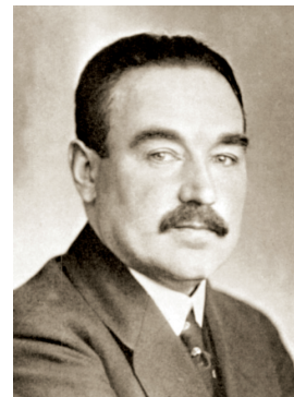
А. Г. Шляпников