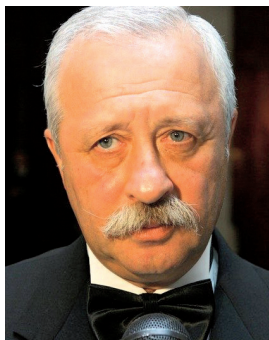
Я. А. Якубович

ЯНКОВСКИЙ Олег Иванович (23.02.1944, Джезказган, Казахская ССР — 20.05.2009, Москва), советский и российский актер театра, кино и телевидения, кинорежиссер, народный артист РСФСР (1984), СССР (1991), лауреат Государственной премии СССР (1987), премии Ленинского комсомола (1977), дважды лауреат Государственной премии РФ (1996, 2002). Окончил Саратовское театральное училище (1965), зачислен в труппу Саратовского театра драмы. Снимался в кино: «Щит и меч» (1968), «Служили два товарища» (1968), «Тот самый Мюнхгаузен»