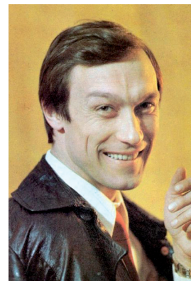
О. И. Янковский