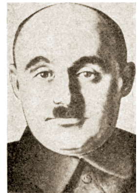
А. Я. Буткевич

БУТКЕВИЧ Александр Яковлевич (январь 1900, с. Тисуль Мариинского уезда Томской губ. — 11.11.1966, Москва), советский партийный и государственный деятель. Участник установления советской власти в Томске. С 1919 в РККА. После окончания Гражданской войны на партийной, советской и хозяйственной работе. С января 1929 по август 1930 председатель исполкома Орловского окружного Совета. В 1930—1931 председатель Центрально-Черноземного областного СНХ.