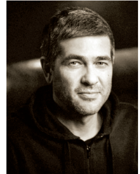
А. Г. Васильев

ВАСИЛЬЕВ Александр Георгиевич (15.07.1969, Ленинград), российский музыкант, поэт, композитор, автор и исполнитель песен. С 1986 учился в Ленинградском институте авиационного приборостроения. Участник группы «Митра». В 1987—1989 проходил службу в СА. С 1992 учился на экономическом факультете театрального института. Работал в театре «Буфф». Лидер группы «Сплин». В июле 1998 выступал в Челябинске (стадион «Центральный»).