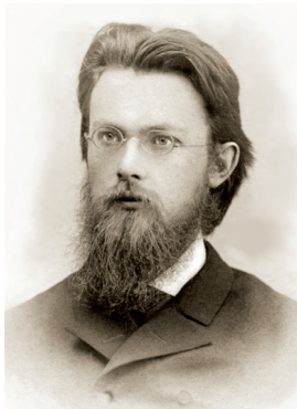
В. И. Вернадский

ВЕРНАДСКИЙ Владимир Иванович (28.02(12.03).1863, Санкт-Петербург — 06.01.1945, Москва), минералог, геохимик, естествоиспытатель, академик, лауреат Государственной премии СССР (1943), один из основоположников генетической минералогии и геохимии. Окончил физико-математический факультет Петербургского университета (1885). Работал в АН (1906—1945), Московском университете (1890—1906). Сформулировал учение о биосфере и ее эволюции, преобразовании биосферы в ноосферу; положил начало радиогеологии. В 1910—1916 руководитель Радиевой экспедиции АН. В 1897, 1911—1913 посещал Ильменские горы. Занимался изучением золотоносного района Саянских гор, исследованием ильменских минералов в лабораториях Минералогического музея и Радиевого института. Пополнил кадастр ильменских минералов: внес в него микролин рубидиевый (1909) и иксиолит (1910). Инициатор идеи ограничения в Ильменских горах горных промыслов и создания в них государственного заповедника. Член УОЛЕ (с 1913) и других научных обществ России, почетный член научных обществ многих зарубежных стран. Выступал за создание Комиссии по изучению естественных и производственных сил страны, был ее председателем (1915—1930). Первый президент АН УССР (1919—1921). Инициатор создания и директор многих НИИ. По Оренбургскому избирательному округу был выбран членом Учредительного собрания по спискам партии народной свободы (1918). В 1941 прислал в газету «Челябинский рабочий» телеграмму, в которой просил