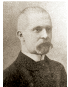
Д. П. Голицын-Муравлин

ГОЛИЦЫН-МУРАВЛИН Дмитрий Петрович (06.12.1860, Висбаден, Германия — 16.12.1928, Вышеград, Югославия), князь, государственный и общественный деятель, писатель, тайный советник (1909). По окончании Императорского Александровского лицея (1881) поступил на службу в Государственную канцелярию. С 1893 помощник статс-секретаря Государственного совета и управляющий казначейской частью Государственной канцелярии. С 1903 член Совета министра просвещения; проводил ревизии в учебных округах, на местах определял необходимость решений учебного ведомства. В ходе одной из поездок по стране, в сентябре 1903, посетил Челябинск. Содействовал открытию Челябинске низшей ремесленной школы, в память о чем в день ее открытия (06.12.1903) Голицыным-Муравлиным была отправлена приветственная телеграмма. С 1910 главноуправляющий Собственной Его