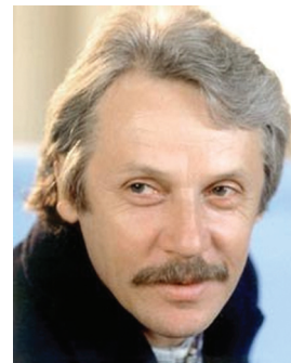
В. И. Алексеев

АЛЕКСЕЕВ Валерий Иванович (1948, г. Усолье-Сибирское Иркутской обл.), советский театральный актёр и режиссёр, педагог, народный артист Российской Федерации (1997). В 1967 окончил актёрское отделение Иркутского театрального училища, работал в Иркутском театре драмы. С 1973 артист Омского театра драмы. В августе 1981 выступал в Челябинске. Среди его ролей — Лот («Царствие земное»), Коняев («Восточная трибуна»), Илья («Московские кухни»), Спирид («Панночка»), Кортес («Церемонии зари»), Полковник («Полковнику никто не пишет»), Басов («Дачники»). В 1970—1980-е был режиссёром эстрадно-сатирического театра миниатюр Омского института инженеров железнодорожного транспорта, в 1990-е работал в Ли-