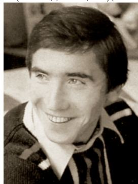
А. Н. Голиков

ГОЛИКОВ Александр Николаевич (26.11.1952, Пенза), советский хоккеист (нападающий), заслуженный мастер спорта СССР (1978), подполковник КГБ. Воспитанник Пензенской детской спортивной школы профсоюзов «Труд» по хоккею с шайбой. Выступал за «Дизелист» (Пенза) (1967—1971), «Химик» (Воскресенск) (1971—1976), «Динамо» (Москва) (1976—1983). 8.03.1972, 10.02.1978 и 17.10.1980 в Челябинске в матчах с командой «Трактор» забросил по одной шайбе.