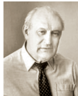
Б. Г. Голубовский

ГОЛУБОВСКИЙ Борис Гаврилович (1919 — 09.02.2008, Москва), советский и российский театральный режиссёр, театральный педагог, народный артист РСФСР (1976), заслуженный деятель искусств РСФСР (1967). После окончания режиссёрский факультет ГИТИСа в 1941 (курс Н. М. Горчакова и Ф. Н. Каверина) работал в Саратовском АТД. В годы Великой Отечественной войны был режиссёром Московского комсомольского фронтового театра ГИТИСа и театра миниатюр «Огонёк», работал режиссёром на радио. В 1950—1954 главный режиссёр Московского областного театра драмы, в 1957—1965 главный режиссёр московского ТЮЗа. С 1965 по 1987 возглавлял Московский драматический театр им. Н. В. Гоголя. С 1975 преподавал в ГИТИСе. Театральные постановки (Московский драматический театр им. Н. В. Гоголя): 1965 — «Ужин в Санлисе» Ж. Ануя; 1966 — «Я отвечаю за все» М. Рогачевского по Ю. П. Герману; 1968 — «Верхом на дельфине» Л. А. Жуховицкого; 1969 — «Белые и черные» А. Котова; 1970 — «Земля» Н. Е. Вирты; 1973 — «Карьера Бекетова» А. В. Софронова; 1974 — «Рок-н-ролл на рассвете» Т. Колесниченко и В. Некрасова; 1977 — «Берег» Ю. В. Бондарева (в августе 1983 представлял спектакль в Челябинске); 1980 — «Закон» по А. И. Ваксбергу; 1981 — «Безобразная Эльза» Энсио Рислакки (совместно с Алексеем Чаплеевским; 1983 — «...А этот выпал из гнезда» Д. Вассермана (по роману К. Кизи «Полёт над гнездом кукушки»). Лауреат Государственной премии РСФСР им. К. С. Станиславского. Награжден орденом Дружбы (1999).