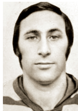
В. Н. Гуреев

ГУРЕЕВ Валентин Николаевич (12.03.1946 — 17.09.2018, Москва), советский хоккеист (нападающий), тренер, мастер спорта международного класса, заслуженный тренер России. В 1964—1966 выступал за «Торпедо» (Усть-Каменогорск), в 1966—1969 за СКА (Ленинград), в 1969—1978 за «Спартак» (Москва), в 1978—1982 за «Капфенберг» (Австрия). 8.05.1975 в Челябинске в матче с командой «Трактор» забросил одну шайбу. Спортивные достижения: чемпион СССР — 1976; серебряный призёр чемпионата СССР — 1970, 1973; бронзовый призёр чемпионата СССР — 1972, 1975; обладатель Кубка СССР 1970—1971. В чемпионатах СССР провёл 411 матчей, забросил 154 шайбы. В 1983—1985 тренер «Кристалла» (Саратов). В 1985 и. о. старшего тренера «Кристалла» (Саратов). В 1986—1987, 1989—1990 тренер молодёжной сборной СССР. В 1993—1995 главный тренер «Спартак» (Москва). В 1996—1999, 2003—2004 старший тренер молодёжной сборной России. В 2004—2005 старший тренер ХК «Северсталь» (Череповец). В 2005 старший тренер ХК МВД. В 2006—2007 главный тренер ХК «Химик» (Воскресенск). С 2008 главный тренер женской сбор-