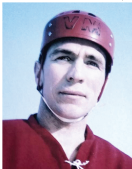
В. С. Давыдов

ДАВЫДОВ Виталий Семёнович (03.04.1939, Москва), советский хоккеист (защитник), заслуженный мастер спорта СССР (1963), заслуженный тренер СССР (1979). Начиная с дворового хоккея. Играл в юношеской команде «Динамо». Выступал за «Динамо» (Москва) (1957—1973). 30.10.1970 в Челябинске в матче с командой «Трактор» забросил одну шайбу. Спортивные достижения: трёхкратный Олимпийский чемпион (1964, 1968, 1972); Чемпион мира 1963—1971. На ЧМ и ЗОИ провел 72 матча, забил 2 гола. В 1967 признан лучшим защитником чемпионата мира. Второй призёр чемпионатов СССР 1959, 1960, 1962—1964, 1971, 1972; третий призёр 1958, 1966—1969. Обладатель Кубка СССР 1972. В чемпионатах СССР сыграл 519 матчей, забросил 39 шайб. После завершения карьеры спортсмена, ушёл в тренеры, возглавлял юношескую сборную СССР, молодёжную сборную СССР (обе сборные под его руководством становились чемпионами мира) (ЧЕ-1976 и ЧМ-1977), клуб «Динамо» Москва (старший тренер в 1979—1981). Окончил МОПИ (1965), преподаватель. Член КПСС с 1970. В 1981—1984 тренировал венгерский хоккейный клуб «Уйпешт Дожа» (два чем-