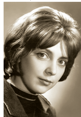
Л. Н. Долгорукова

и кино, заслуженная артистка РСФСР (1971), лауреат премии Московского комсомола. Окончила актёрский факультет ГИТИСа (курс народного артиста РСФСР Г. Конско-го; 1961). В 1961—1965 — актриса Московского ТЮЗа. С 1961 — актриса Московского драматического театра им. Н. В. Гоголя. В июле 1965 выступала в Челябинске. С 1986 участвовала в постановках театра на Юго-Западе. Играла в спектаклях театра «Мастерская Петра Фоменко» («Бесприданница», «Три сестры»). Снималась в кино: «Горизонт» (1961), «Черный квадрат» (1992), «Таксист» (2003), другие фильмы. Награждена медалью ордена «За заслуги перед Отечеством» II степени (2000).