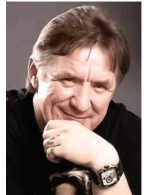
С. А. Дроздов

Полесья». Солист вокально-инструментального ансамбля «Синяя птица» (1974—1988). Получил известность в 1970-х как первый исполнитель шлягеров «Там, где клён шумит...», «Ты мне не снишься», «Я иду тебе навстречу», «Белый теплоход». В составе ансамбля записал более 80 % всего репертуара. 46 песен исполнил сольно. В апреле 1981 выступал в Челябинске. В 1984 заочно окончил Тамбовский филиал Московского государственного института культуры по специальности «дирижёр-оркестрант». В 1989 вокалист группы «Красная площадь» (ранее — «Галактика»). В 1989 на гастролях в ФРГ, в 1990 — в США. В 1991—1998 занимался сольной карьерой. В 2002 основал группу «Синяя птица Сергея Дроздова». Группа гастролировала по стране и за её пределами (Белоруссия, Украина, Германия). Лауреат конкурса «Алло, мы ищем таланты» (Москва, 1972).