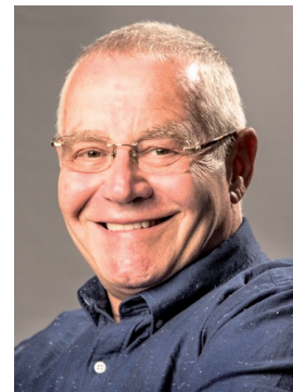
А. Б. Журбин