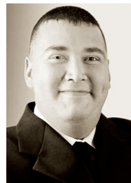
О. Е. Жуков

ЖУКОВ Олег Евгеньевич (11.10.1973, г. Иваново — 09.02.2002, там же), российский певец, рэпер. В 1988 работал в кукольном театре, озвучивая персонажей спектаклей. С 1989 учился в Ивановском государственном энергетическом институте, не окончил. Проходил службу в Российской Армии. С 1991 начал выступать в группе «Дискотека Авария». На раннем этапе существования группы был фронтменом коллектива. В сентябре 1999 выступал в Челябинске (стадион «Центральный»).