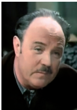
В. А. Калмыков

КАЛМЫКОВ Владимир Алексеевич (9.12.1927 — 27.03.2008, Москва), советский и российский актёр театра и кино, заслуженный артист РСФСР (1977), народный артист РФ (2002). В 1948 окончил студию при Московском ТЮЗе. С 1951 в труппе Московского театра юного зрителя (ныне РАМТ). Роли в театре: «Вишнёвый сад» А. П. Чехова — Фирс; «Лоренцаччо» — Кардинал Баччо Валори, папский уполномоченный; «Приключения Тома Сойера» — Судья Тэтчер. В сентябре 1999 выступал в Челябинске (спектакль «Капитанская дочка»). Снимался в кино: «Приключения Кроша» (1961), «Голубая чашка» (1964), «Печники» (1982), «Поворот ключа» (1999), «Алмазы на десерт» (2006).