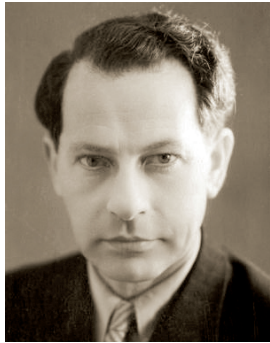
И. Я. Кастрель

КАСТРЕЛЬ Исаак Яковлевич (1917, Нижний Новгород — 2000, Москва), советский актёр театра, заслуженный артист РСФСР (1957). Первоначально обучался в театрально-музыкальной студии при Московском театре революции (1936—1938). В 1940—1950 работал в качестве актёра в театре Приморского военного округа в городе Ворошилов (ныне Уссурийск). Затем работал в Пермском драматическом театре (1950—1958). Исполнил около 40 разноплановых ролей. В 1958—1992 работал в Московском драматическом театре на Малой Бронной. Театральные работы: маршал Бертье (Ф. Брукнер, «Наполеон I»), Яковлев (М. Горький, «Фальшивая монета»), Альфиери (А. Миллер, «Вид с моста»), Ислаев (И. Тургенев, «Месяц в деревне»), Бургомистр (Ф. Дюрренматт, «Визит дамы»), Сталин (К. Симонов, «Солдатами не рождаются») и другие спектакли. В июне 1981 выступал в Челябинске. Снимался в кино: «Набат на рассвете» 1985 — министр просвещения; «Моби Дик» (фильм-спектакль) (1972) — Ахаб; «Вызываем огонь на