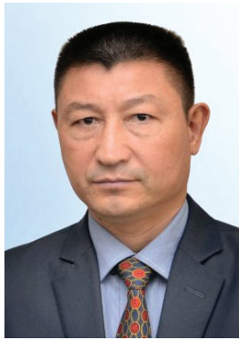
Ю. Я. Арбачаков