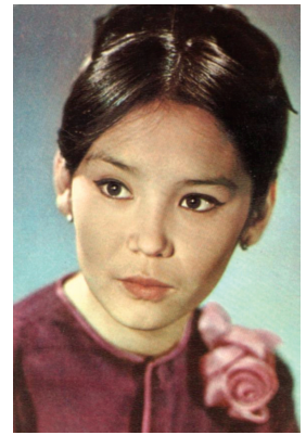
Н. У. Аринбасарова

чекистка Сауле; «У озера» (1969) — бурятка Катя Олзоева; «Спокойный день в конце войны» (1970) — Адалат; «Выбор» (1975) — Бибигуль; «Встречи на Медео» (1976) — Айжан; «Транссибирский экспресс» (1977) — Айжан; «Вкус хлеба» (1979) — Камшат Сатаева; «Провинциальный роман» (1981) — адвокат; «Первая конная» (1984) — Полина; «Визит к Минотавру» (1987) — музыковед Марина; «Вход в лабиринт» (1988) — Рашида Аббасовна Рамазанова; «Нет чужой земли» (1990) — Дижит; «Семьянин» (1991) — Фара; «Прекрасная незнакомка» (1992) — мисс Сузуки; «За что?» (1995) — жена коменданта; «Саранча» (2001—2003) — психолог; «Побег» (2005) — директор детдома; «Мустафа Шокай» (2008) — мать Шокая; «Всё ради тебя» (2010) — гадалка; «Небо моего детства» (2011) — мать Нурсултана Назарбаева; «Сон как жизнь» (2014) — Раушания Агабовна; «Холодное сердце» (2016) — Каминская; «А. Л. Ж. И. Р.» (2018) — Байлам; другие фильмы. В мае 1983 в Челябинске приняла участие в программе «Поет товарищ кино». Автор воспоминаний «Лунные дорожки» (1999). Обладательница золотого кубка Вольпи на XXVI Международном кинофестивале в Венеции (1966). Лит.: Здравствуй, товарищ кино! // ВЧ. 1983. 27 мая.