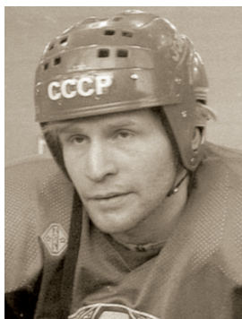
В. Н. Константинов

(19.03.1967, Мурманск), советский и российский хоккеист (защитник), заслуженный мастер спорта СССР (1989). Обучался в школе олимпийского резерва ЦСКА. Выступал за ЦСКА и сборную СССР. 08.03.1986 в Челябинске в матче с командой «Трактор» забросил одну шайбу. Чемпион мира 1986, 1989 и 1990 годов. Чемпион мира среди молодёжи 1986. С 1992 выступал в НХЛ, за шесть сезонов провёл 446 игр, набрав 174 очков (47 голов и