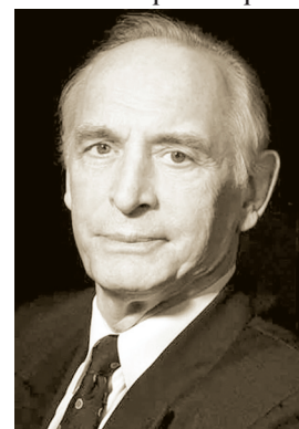
В. С. Лановой

ЛАНОВОЙ Василий Семёнович (16.01.1934, Москва), советский и российский актёр театра и кино, мастер художественного слова (чтец), общественный деятель, театральный педагог, Герой Труда Российской Федерации (2019), народный артист РСФСР (1978), СССР (1985), Республики Северная Осетия — Алания (2015), лауреат Ленинской премии (1980). Член КПСС (1968—1991). В 1947 начал заниматься в театральной студии при Дворце культуры ЗИЛа. Окончил школу с золотой медалью. В 1953 поступил на факультет журналистики МГУ, но проучился там всего полгода. В 1957 окончил театральное училище им. Б. Щукина (курс Ц. Л. Мансуровой). С 1957 актёр Государственного академического