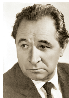
Е. А. Лебедев

ЛЕБЕДЕВ Евгений Алексеевич (15(02).01.1917, г. Балаково, ныне Саратовской обл. — 09.06.1997, Санкт-Петербург), советский российский актёр театра и кино, педагог, Герой Социалистического Труда (1987), народный артист РСФСР (1962), СССР (1968), лауреат Ленинской премии (1986), Сталинской премии 1-й степени (1950), Государственной премии СССР (1968), Государственной премии РСФСР им. братьев Васильевых (1980), почетный гражданин г. Балаково (1987), Тбилиси (1992), Санкт-Петербурга (1996). С 1927 воспитывался у деда в Самаре, учился в средней школе № 13 им. В. Чапаева, затем в ФЗУ при заводе «Кинап», участвовал в заводской художественной самодеятельности. В 1932 поступил в ТРАМ в Самаре. В 1933 пере-