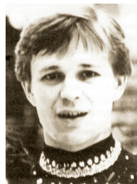
И. О. Лисовский

ЛИСОВСКИЙ Игорь Олегович (12.10.1954), советский фигурист, выступавший в одиночном и парном катании, мастер спорта СССР международного класса. В паре с И. Воробьевой — чемпион мира — 1981 и чемпион Европы — 1981. В январе 1983 выступали в Челябинске на чемпионате СССР. В июне — июле 1983 в Челябинске приняли участие в представлении «Звезды фигурного катания и мастера эстрады», в мае 1984 — «Все звезды», в декабре 1986 — в показательных выступлениях. В начале 1990-х уехал в США, где работает тренером в «Creve Coeur Figure Skating Club».