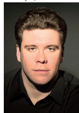
Д. Л. Мацуев