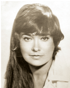
Т. Д. Надеждина

НАДЕЖДИНА Татьяна Дмитриевна (30.12.1931 — 02.11.2019, Москва), советская актриса, народная артистка России (2003). В 1954 окончила театральное училище им. Щукина и была принята в труппу Российского академического молодёжного театра. Театральные работы: «Женитьба» Н. В. Гоголя — Агафья Тихоновна; «Таня» А. Арбузова — Бабушка (2003); «Принц и нищий» М. Твена — Дженни (2001); «Приглашение на казнь» В. Набокова — Попечительница, Бабка (2009). В сентябре 1999 выступала в Челябинске (спектакль «Капитанская дочка»). Снималась в кино: «Девичья весна» (1960), «Семь нянек» (1963), «Кража» (1970) и другие фильмы.