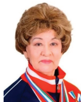
Л. Б. Назмутдинова

пионкой РСФСР и СССР. Более 10 лет была капитаном сборной СССР по художественной гимнастике. В 1965 на чемпионате мира выиграла бронзу в упражнениях с предметами. После завершения спортивной карьеры продолжила тренерскую работу (до 1999). Судья и член апелляционного жюри VII летней Спартакиады народов СССР по художественной гимнастике (1979, Челябинск). Награждена медалями. Лит.: Поэзия движения / Л. Коган // ВЧ. 1979. 2 июня.