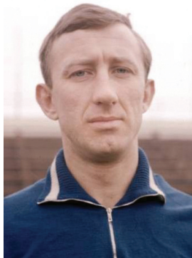
И. А. Нетто

Лит.: «Трактор» Челябинск : справочник / авт.-сост. В. А. Соколов. Челябинск, 1988.