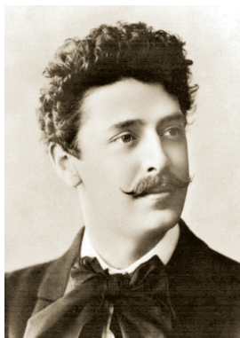
П. Н. Орленев

31.08.1932, там же), русский актёр, народный артист Республики (1926). Учился во 2-й московской гимназии, был исключен. В 1885 поступил в драматическую школу театрального училища при московском Малом театре. Летом устроился в театр в Вологду. С 1886 по 1891 играл в провинциальных театрах (Вологды, Риги, Нижнего Новгорода, Вильно, Минска, Ростова-на-Дону), в