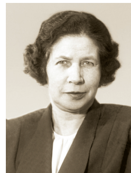
В. А. Осеева

ОСЕЕВА Валентина Александровна (Осеева-Хмелева) (28(15).04.1902, Киев — 05.07.1969, Москва), русская советская детская писательница, лауреат Сталинской премии 3-й степени (1952), жена писателя В. Д. Охотникова. По окончании средней школы училась до 1923 на актёрском факультете Киевского института им. Н. В. Лысенко. Переехала в Москву. В 1924—1940 работала педагогом и воспитателем в детских коммунах и приёмниках