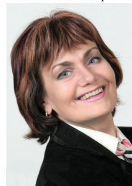
Г. К. Петрова

ПЕТРОВА Галина Кранидовна (13.07.1945, ст. Салаван Ульяновской обл.), певица (драматическое сопрано), актриса оперетты, народная артистка РСФСР (1983), лауреат премии им. А. Г. Маренича (1993). По окончании средней школы в 1962 поступила в Волжский народный хор в качестве члена танцевальной группы. В 1970 окончила Государственный институт театрального искусства в Москве, отделение музыкальной комедии (педагог И. М. Туманов).