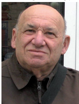
А. М. Плакхин

ПЛАКХИН Аркадий Миронович (1940, Полоцк), советский и белорусский спортсмен (русские шашки), международный гроссмейстер (1995), гроссмейстер СССР (1974), заслуженный мастер спорта Республики Беларусь (2005), мастер ФМЖД по международным шашкам, мастер спорта СССР (1954). Чемпион мира (1994—1995), четырёхкратный чемпион СССР (1960 (сопобедитель З. Цирик), 1963, 1972 (сопобедители Ю. Кустарев, П. Миловидов), 1974. 29-кратный участник чемпионатов СССР. В сентябре 1965 в Челябинске принял участие в полуфинале шашечного первенства СССР. 14-кратный чемпион Белоруссии (13 раз в шашки-64 и 1 раз в шашки-100), двукратный чемпион ВЦСПС. Проработал 40 лет рабочим на заводе «Горизонт» (Минск). Лит.: Победили шашкисты Минска / Б. Бернштейн // ЧР. 1965. 15 сент.