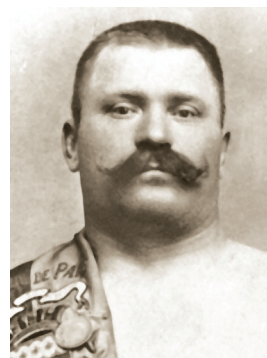
И. М. Поддубный

ПОДДУБНЫЙ Иван Максимович (08.10(26.09).1871, с. Богодуховка Золотоношского уезда Полтавской губ., ныне Чернобаевский район Черкасской обл., Украина — 08.08.1949, Ейск), российский и советский профессиональный борец, атлет и артист цирка, заслуженный артист РСФСР (1939), заслуженный мастер спорта СССР (1945). Из запорожских казаков. С детства был приучен к тяжёлой крестьянской работе и с 12 лет батрачил. В 1893—1896 портовый груз-