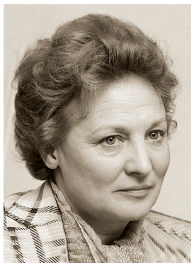
А. Б. Покровская

ПОКРОВСКАЯ Алла Борисовна (18.09.1937, Москва — 25.06.2019, там же), советская и российская актриса театра и кино, театральный режиссёр, народная артистка РСФСР (1985), жена О. Ефремова. Педагог школы-студии МХАТ, профессор (1988). Год училась на филологическом факультете Московского педагогического института. Занималась в театральном кружке при московском Доме учителя. В 1959 окончила школу-студию МХАТ (курс В. Станицына).