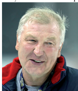
В. Ф. Попов

ПОПОВ Владимир Федорович (03.03.1953), хоккеист (нападающий), заслуженный мастер спорта СССР, заслуженный тренер России. В хоккее начал играть в г. Жуковский Московской области. В ЦСКА с 1966. Выступал на позиции нападающего в составе московских армейцев в 1971—1979, СКА (Ленинград) в 1980—1983. 02.05.1976 в Челябинске в матче с командой «Трактор» забросил одну шайбу.